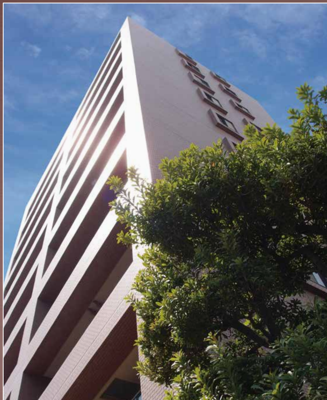
ロイヤルオーク 1K賃貸マンション